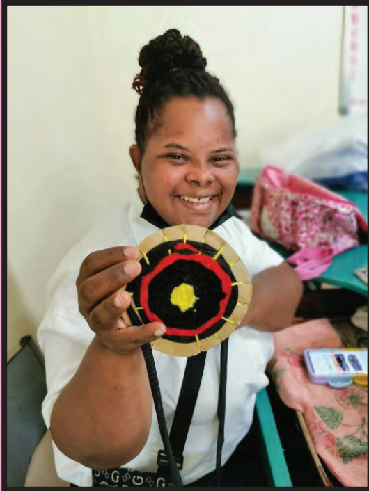
ジャマイカ唯一の知的障害者が通う福祉作業所で、アクセサリブランドでもある「Chupse」(チュップス)にて

現在、知的障害を持つ生徒が通うスペシャルスクールの卒業生を対象に、職業訓練的なプログラムを始められないか、関係機関と交渉しています。半年ほどの期限付きプログラムですが、うまくいけば長期的な居場所づくりに繋がるのではと期待しています。ジャマイカは何事もスローペースで、予期せぬ事態で計画がとん挫、ということもよくあるのですが、根気よく取り組んでいきます。