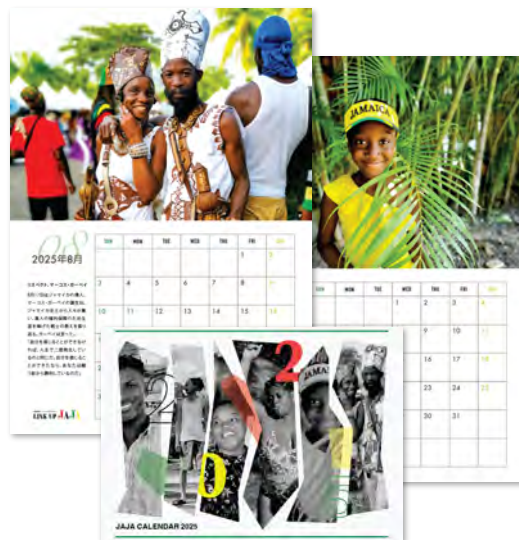
※写真はイメージです。(2025年カレンダー)

Further details will be shared on our social media soon—stay tuned!